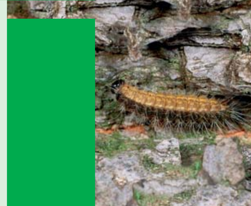
► Raupe mit Gifthaaren