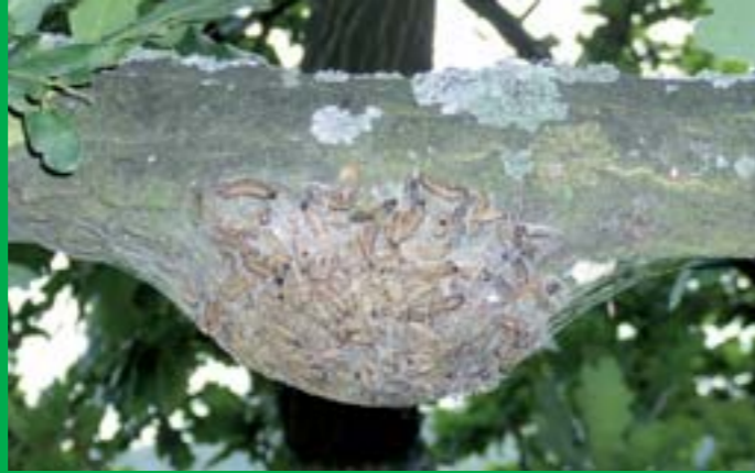
Gefährlich für den Menschen: Raupennest im Sommer vor der Verpuppung