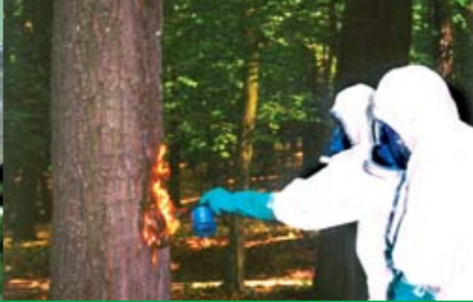
Mitunter ist großer Aufwand notwendig, um den Eichenprozessionsspinner erfolgreich zu bekämpfen.