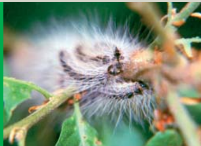
Für den Menschen eine Bedrohung: die langen Haare der Eichenprozessionsspinner-Raupe

In Gebieten des heutigen Nordrhein-Westfalen trat die Falterart erstmals vor mehr als 170 Jahren auf. Nach einigen Jahrzehnten verschwand der Eichenprozessionsspinner von der Bildfläche, bis er fast 130 Jahre später erstmals wieder 2001 im Rheinland und am Niederrhein gesichtet wurde. Der heiße Sommer 2003 beschleunigte seine Vermehrung und Ausbreitung erheblich, so dass sich das Verbreitungsgebiet des Eichenprozessionsspinners in der Folge auch auf den rechtsrheinischen Raum ausgedehnt hat. In den kommenden Jahren wird sich das Befallsgebiet wahrscheinlich noch vergrößern.