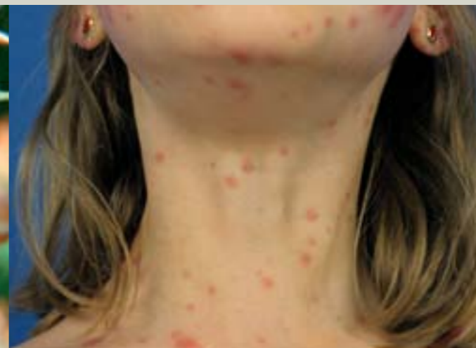
Hautausschlag, hervorgerufen durch die Raupenhaare