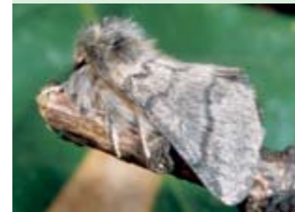
Der für den Menschen ungefährliche Schmetterling fliegt im August.