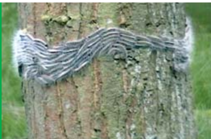
Seine Vorliebe für Eichen und die meterlangen Prozessionen seiner Raupen haben dem Eichenprozessionsspinner seinen Namen gegeben.

Der Eichenprozessionsspinner ( Thaumetopoea processionea Linnaeus) ist ein Forstschädling, der bevorzugt Eichen befällt. Er ist ein eher unscheinbarer, graubrauner Nachtfalter, der auch für Menschen eine Gefahr darstellen kann. Zwar ist der Schmetterling an sich harmlos, doch seine Larven tragen Gifthaare, die auf der Haut und an den Schleimhäuten der Menschen allergische Reaktionen hervorrufen können. Die Beschwerden reichen von heftig juckenden Hautausschlägen (Raupendermatitis) bis zu Asthmaanfällen. Ursache ist das Nesselgift Thaumetoporin auf den Härchen der Larven. Nachdem der Eichenprozessionsspinner in Nordrhein-Westfalen viele Jahrzehnte lang nicht auffällig in Erscheinung getreten ist, wird seit 2001 eine starke Vermehrung des Falters insbesondere am Niederrhein beobachtet.